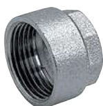
Tappo Femmina forato Perforated female blanking plug