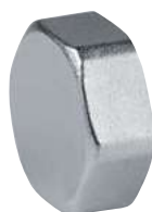
Tappo Femmina Female blanking plug