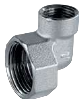
Tappo Femmina curvo Curved female plug