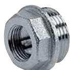
Tappo Maschio forato Perforated male blanking plug