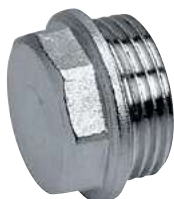
Tappo Maschio Male blanking plug