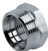
Riduzione esagonale M/F Hexagonal nut M/F